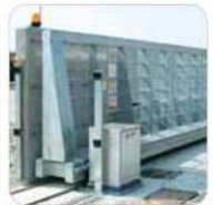
Ejemplo de instalación