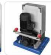
FIBO 300 sin capó