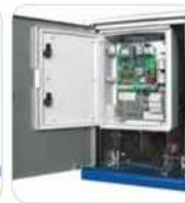
FIBO 400 Interno con programador electrónico (optional)