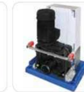
FIBO 400 sin capó