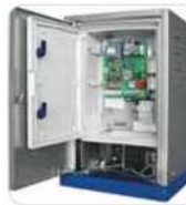
FIBO 300 Interno con programador electrónico (optional)